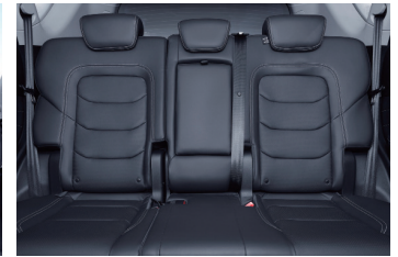
INTERIOR: CONSIDERATE CONFIGURATION TO CREATE A COMFORTABLE ENVIRONMENT 7 SEATS