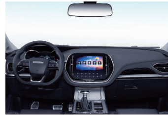
36 DECIBEL LIBRARY-CLASS ULTRA-QUIET COCKPIT