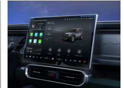
TOUCH SCREEN: LARGE SIZE TOUCH SCREEN DISPLAY SUPPORTS ANDROID AND IOS