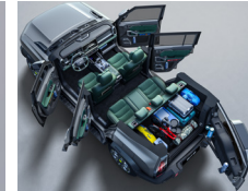
EXTRA LARGE: EXPANDABLE STORAGE SPACE 4785X2006X1880 (MM) EXTRA LARGE SPACE