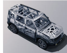
SAFETY: UP TO 80 PERCENT HIGH-STRENGTH STEEL SKELETONIZED BODY