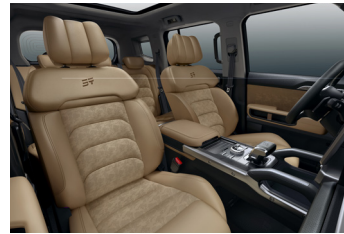
INTELLIGENT ASSISTED LUXURY DRIVING DASHBOARD EQUIPPED WITH LUXURY MATERIALS