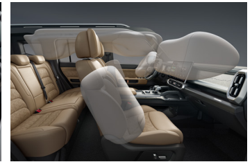
AIRBAGS OR UP TO 80 PERCENT HIGH STRENGTH STEEL SKELETONIZED BODY MATERIALS